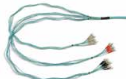
Valmiiksi päätetyt segmentit