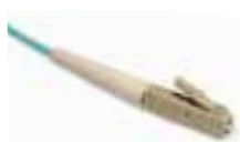
LC IEC 61754-20