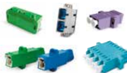
Valokuituadapterit ja liittimet