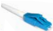
LC-Duplex pyöreille kaapeleille IEC 61754-20