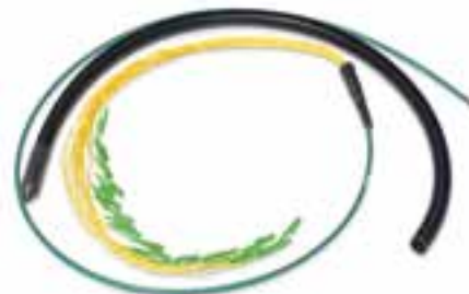
Kuiturunkokaapelit päätettynä ja puristuksenkestävällä suojalla