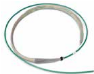
Kuiturunkokaapelit päätettynä tekstiilisuojaalla