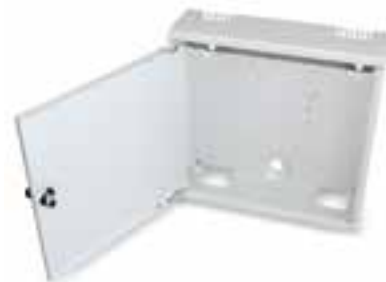
Jakokaapit ja -rasiat kuiduille, seinäasenteinen